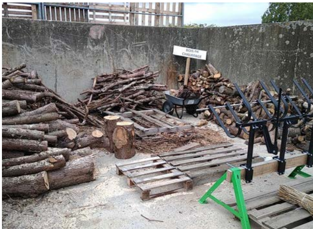
Casier pour déposer/récupérer bois de chauffe

Le syndicat va collaborer avec les « jardins du cœur » (association de réinsertion par le maraîchage), pour donner du compost, broyat pour les activités de maraîchage, et intervenir auprès des personnes en réinsertion.