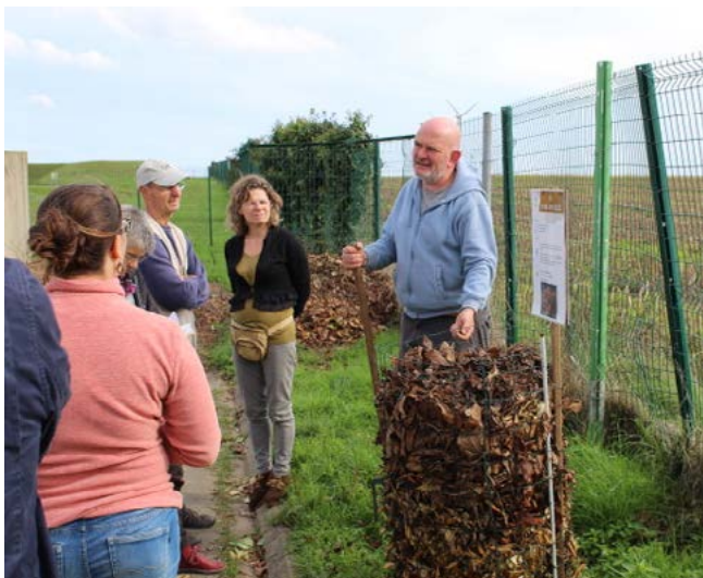
Atelier sur les tours en feuilles mortes