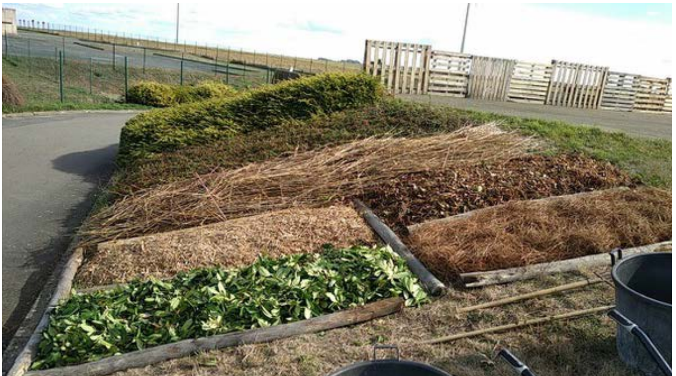
Exemple de paillage avec les déchets verts

Lors de l'ouverture des sites, des flyers ont été distribués dans les boîtes aux lettres des usagers de la commune accueillant la ressourcerie, et des communes voisines. L'information a également été donnée via les bulletins municipaux, réseaux sociaux, presse locale, régionale et nationale, etc.