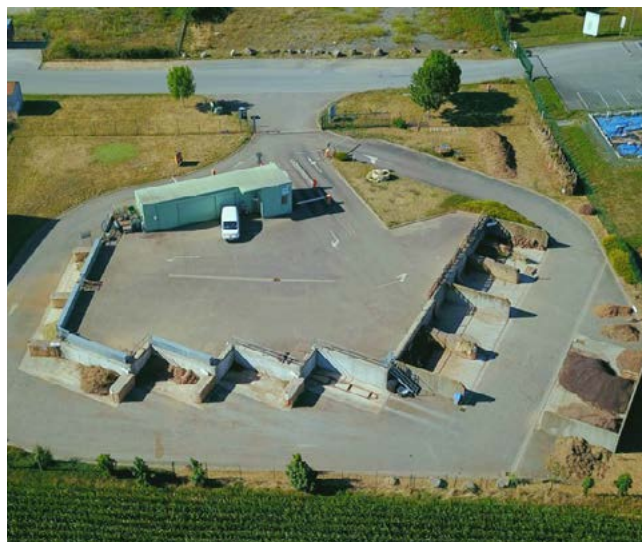
Ressourcerie végétale de Mouzeuil-Saint-Martin

En 2023, les élus ont souhaité ouvrir un second site dans une commune plus centrale. Le lieu est prêté par la municipalité de Fontenay-le-Comte, et aménagé par le SYCODEM (petit aménagement seulement : séparations en bottes de paille, gravier, installation d'un préfabriqué).