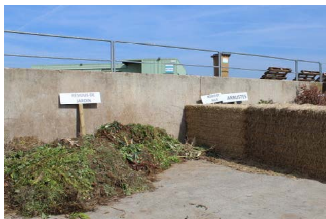
Casier dépose des déchets verts